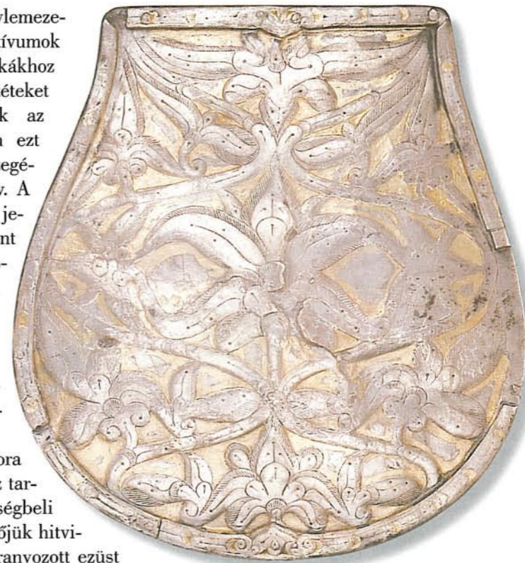
A tarcali tarsolylemez

A „kalandozások” során szerzett arany- és ezüstpénzeket, kincseket és ékszereket idehaza hamarosan beolvasztották, és az ötvösök saját jelképrendszerük, illetve megrendelőik ízlése szerint készítették belőlük különféle alkotásaikat. A pompaszeretethez nagy mennyiségű nemesfémre volt szükség: a férfiak rang- és méltóságjelző övkészletének átlagsúlya körülbelül 20 dkg lehetett, ám egy-egy női lószerszám 1,5 kg ezüstöt is megkívánhatott, nem beszélve a hatalmat birtokló arisztokrácia vagyoni helyzetét tükröző fedelmi, vezéri leletegyüttesekről.