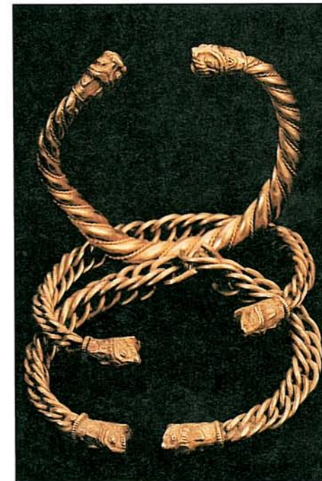
Állatfejes bizánci karperecek Zsenyéről