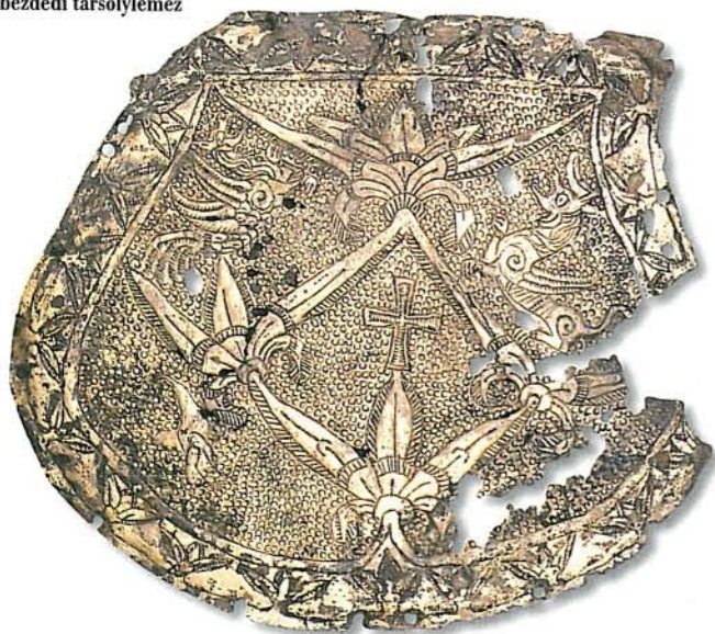
A bezdédi tarsolylemez

mettás ornamentikája. A tarsoly a férfiak jobb oldalán függött az övön, és többnyire tűzszerszámokat (csiholót, kovát, taplót) tartalmazott. A fém fedőlapot domborítással, majd poncolással (poncoló szerszámmal való beütögetéssel) munkálták meg, a minták hátterét gyakran aranyozással is díszítették.