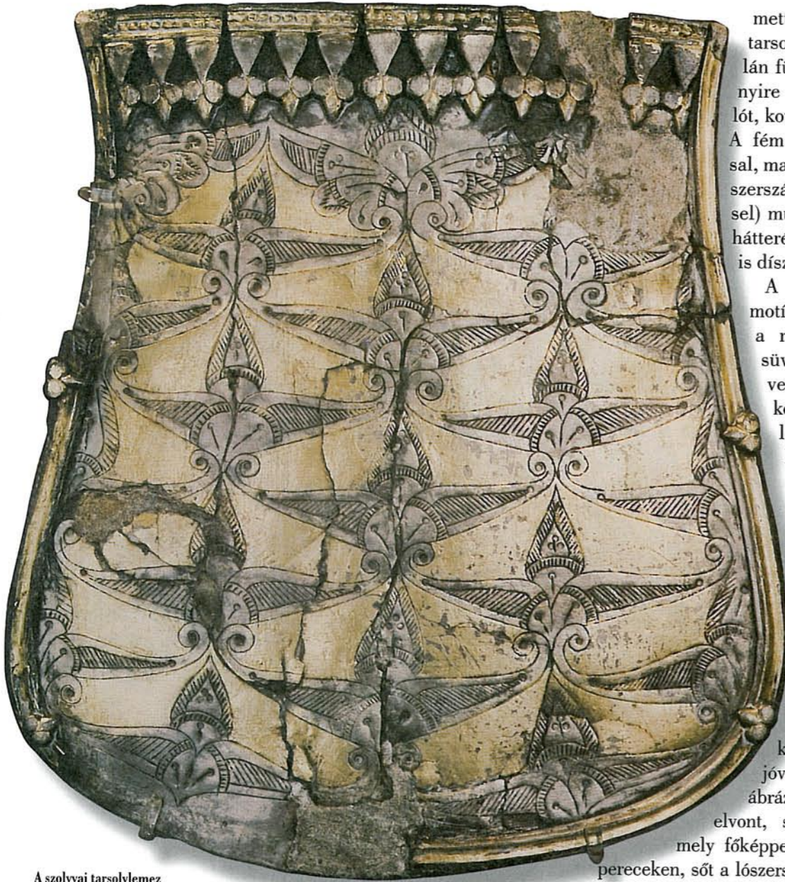
A szolyvai tarsolylemez